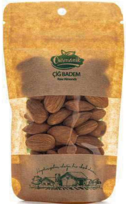
Çiğ Badem Raw Almonds