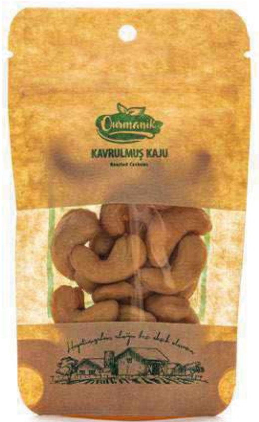
Kavrulmuş Kaju Roasted Cashews