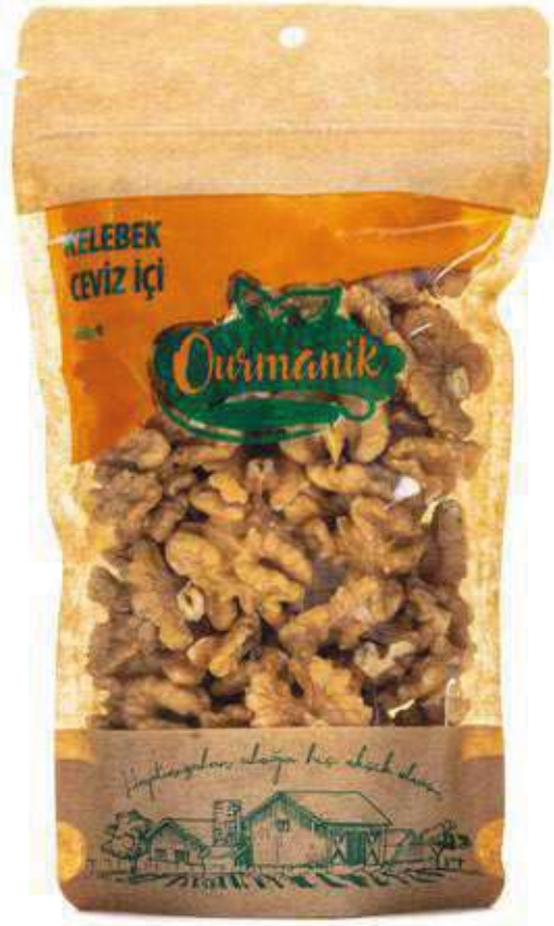
Kelebek Ceviz İçi Walnut 150 GR