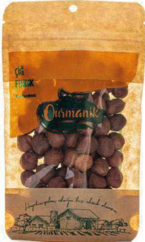
Çiğ Fındık Raw Hazelnuts