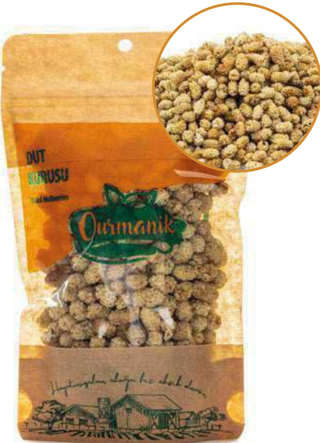
Dut Kuru Dried Mulberries