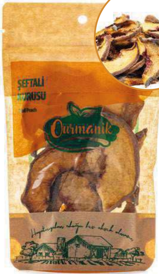
Şeftali Kuruşu Dried Peach