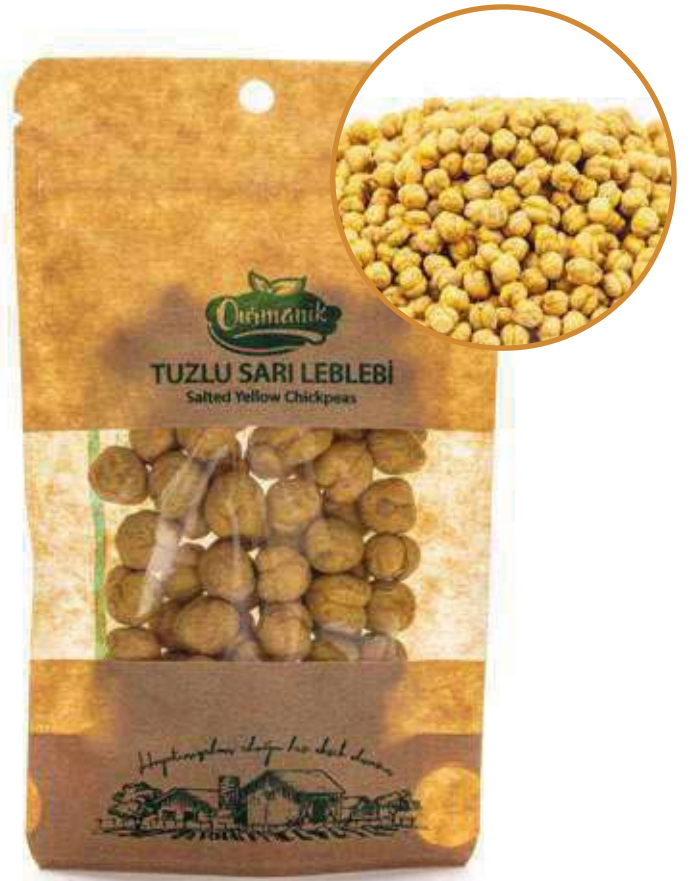
Tuzlu Sarı Leblebi Salted Yellow Chickpeas