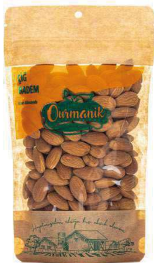
Çiğ Badem Raw Almonds