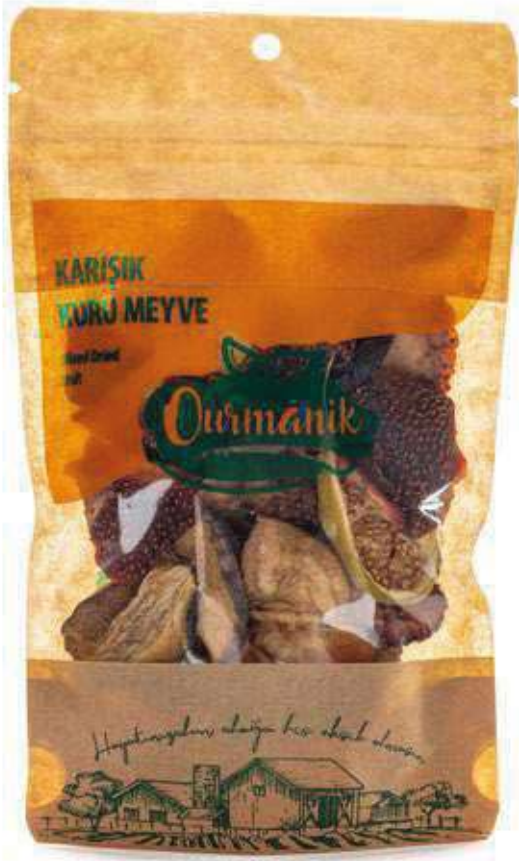
Karışık Meyve Kuru Mixed Dried Fruit