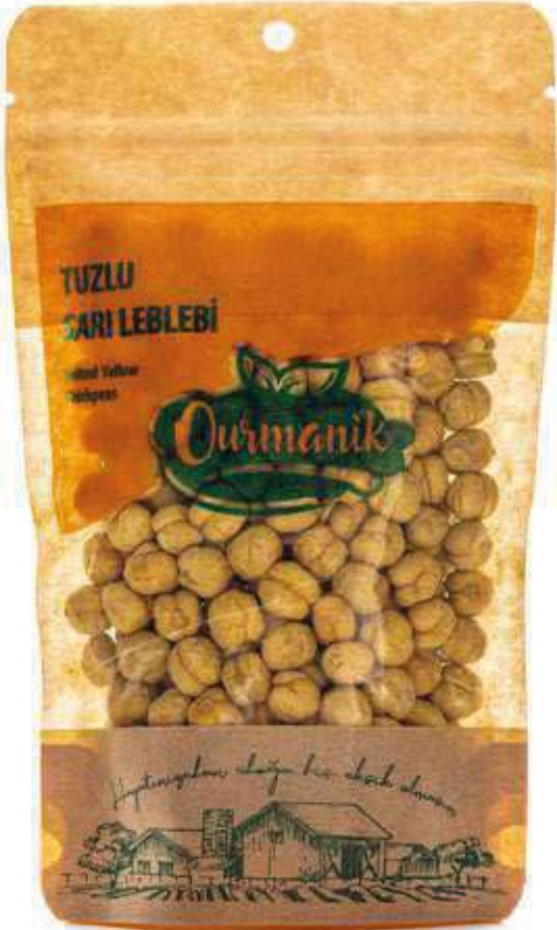
Tuzlu Sarı Leblebi Salted Yellow Chickpeas