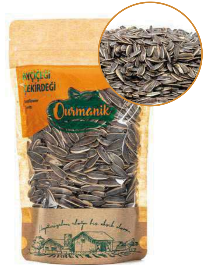
Tuzsuz ekirdek Sunflower Seeds 200 GR