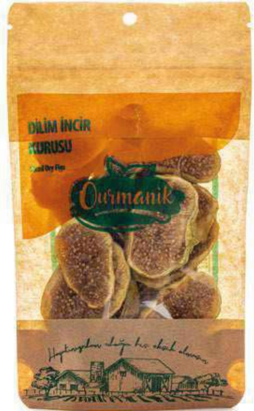
Dilim İncir Kuru Sliced Dry Figs