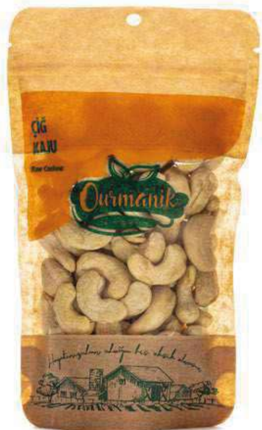
Çiğ Kaju Raw Cashew