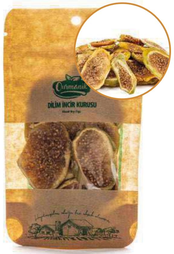
Dilim İncir Kuru Sliced Dry Figs