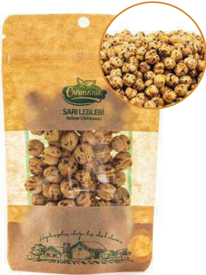
Sarı Leblebi Roasted Yellow Chickpeas