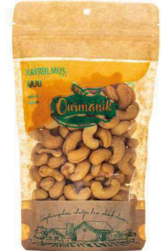
Kavrulmuş Kaju Roasted Cashews