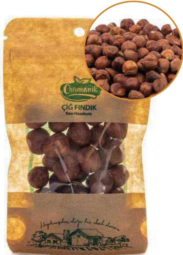
Çiğ Fındık Raw Hazelnuts