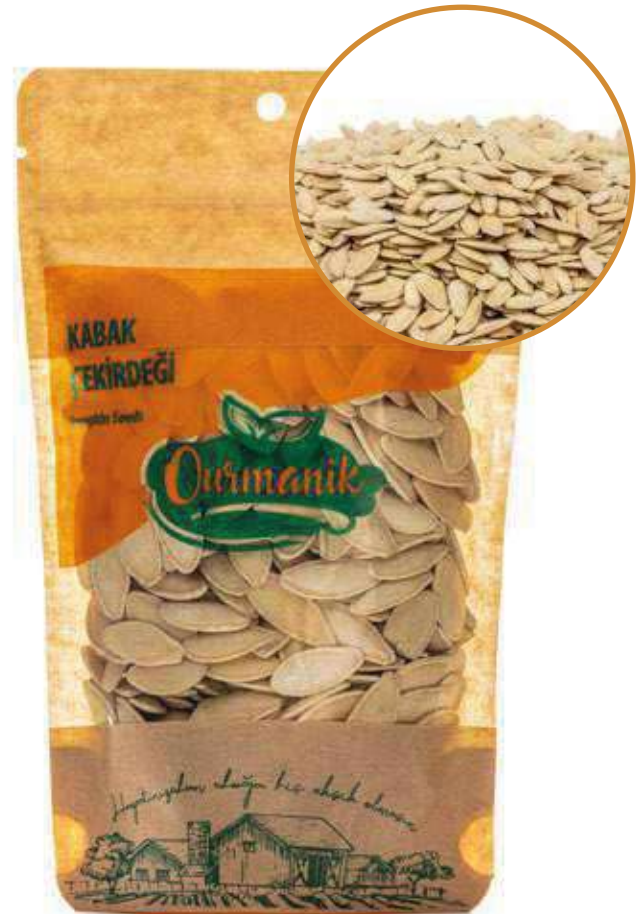
Kabak Çekirdeği Pumpkin Seeds