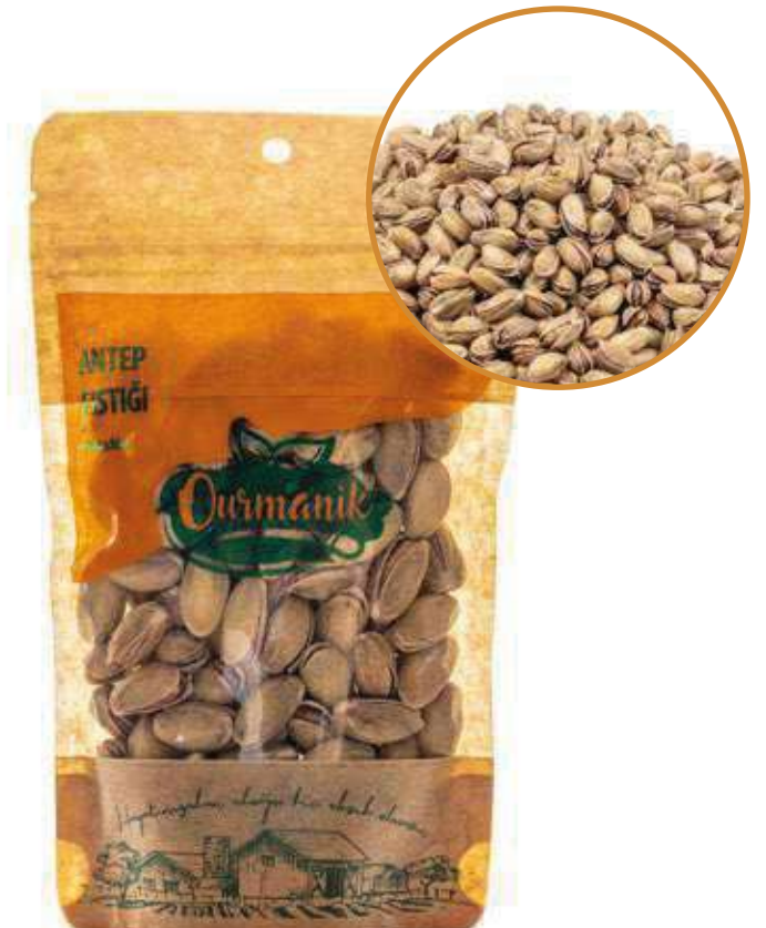
Antep Fıstığı Pistachios