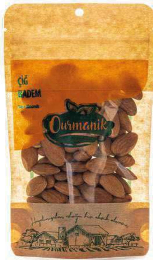
Çiğ Badem Raw Almonds