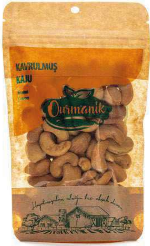
Kavrulmuş Kaju Roasted Cashews