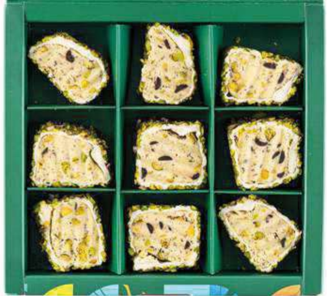
Mega Fıstıklı Lokum Mega Pistachio Turkish Delight 250 GR