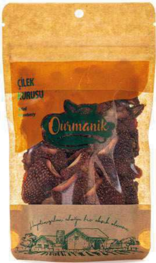
Çilek Kuru Dried Strawberry