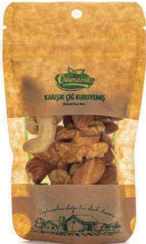
Karişik Çiğ Kuruyemiş Mixed Raw Nuts