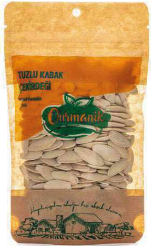
Tuzlu Kabak Çekırdeđi Salted Pumpkin Seeds