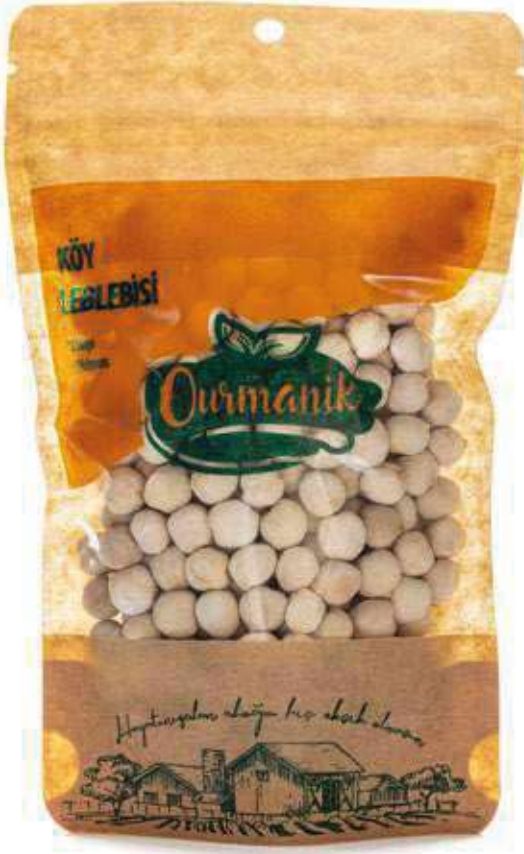
Köy Leblebisi Village Chickpeas