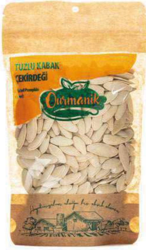
Tuzlu Kabak ekirdeđi Salted Pumpkin Seeds 150 GR