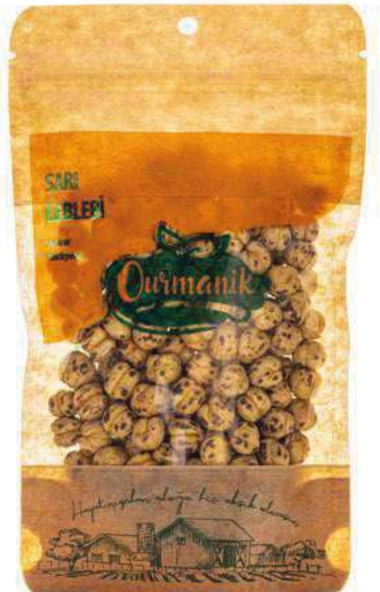
Sarı Leblebi Roasted Yellow Chickpeas