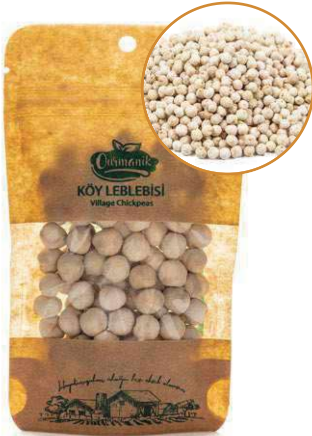
Köy Leblebisi Village Chickpeas