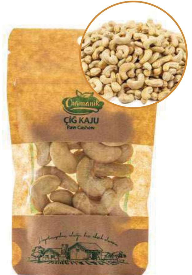
Çiğ Kaju Raw Cashew