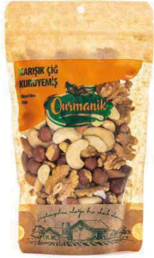
Karışık Çiğ Kuruyemiş Mixed Raw Nuts