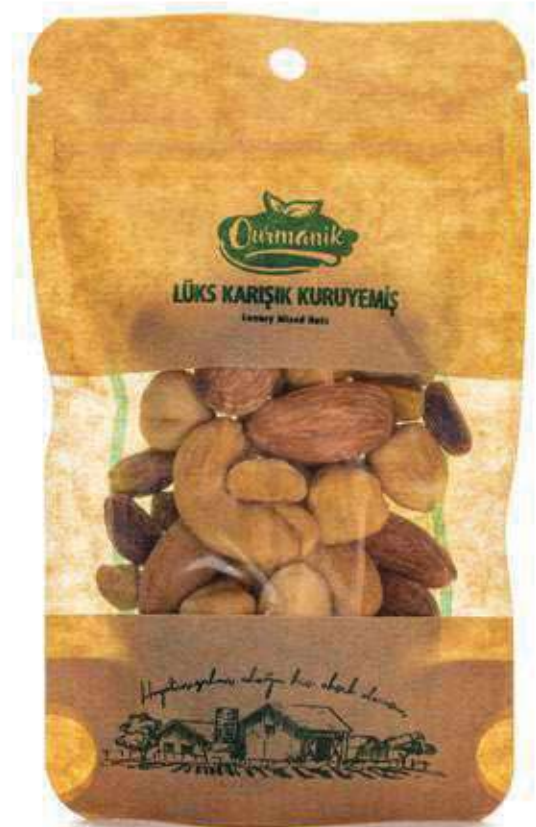
Lüks Karışık Kuruyemiş Luxury Mixed Nuts