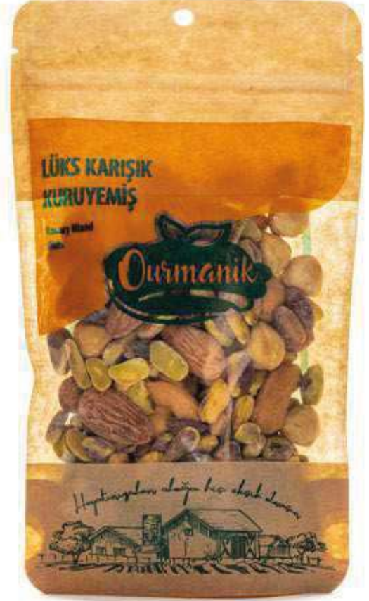
Lüks Karışık Kuruyemiş Luxury Mixed Nuts