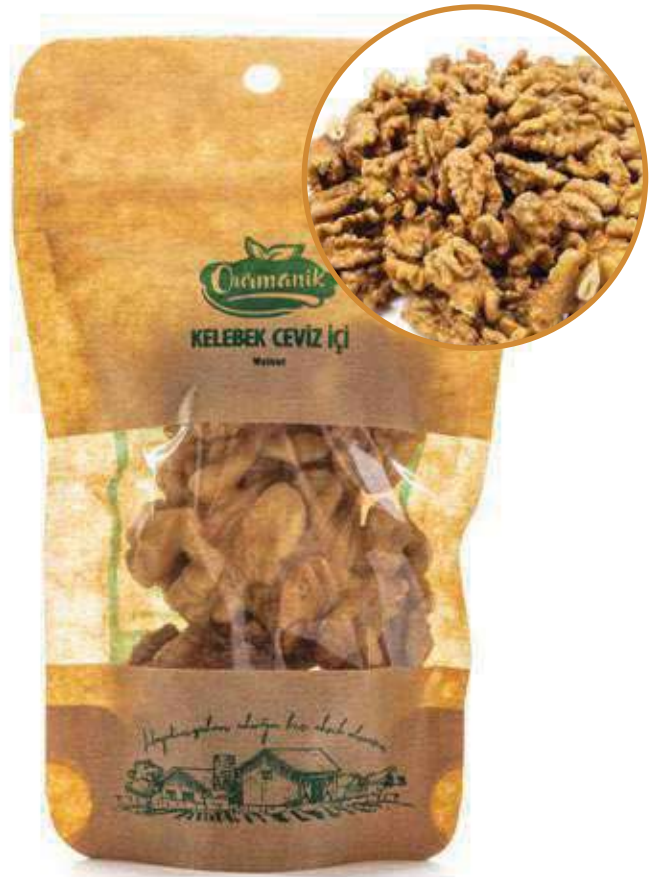
Kelebek Ceviz İçi Walnut