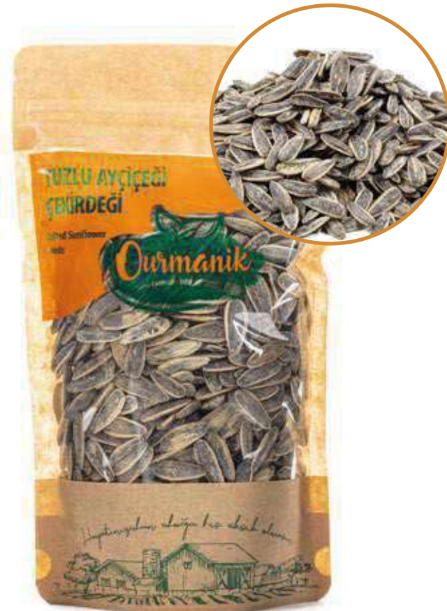
Tuzlu ekirdek Salted Sunflower Seeds 200 GR