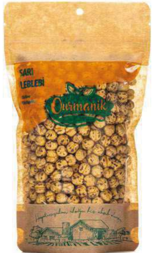
Sarı Leblebi Roasted Yellow Chickpeas 180 GR