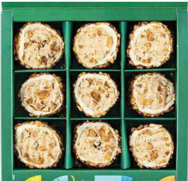
Mega Bademli Lokum Mega Almond Turkish Delight 250 GR