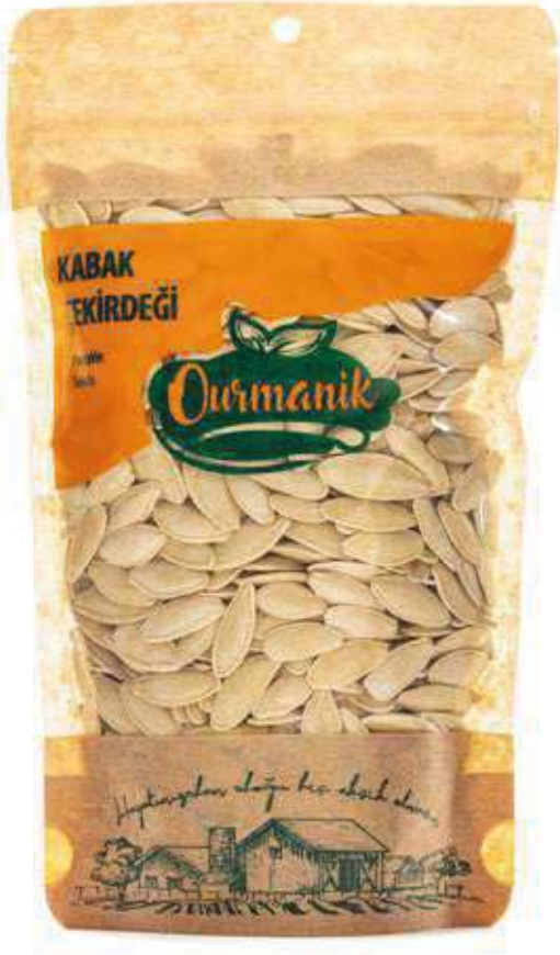
Kabak Çekirdeği Pumpkin Seeds