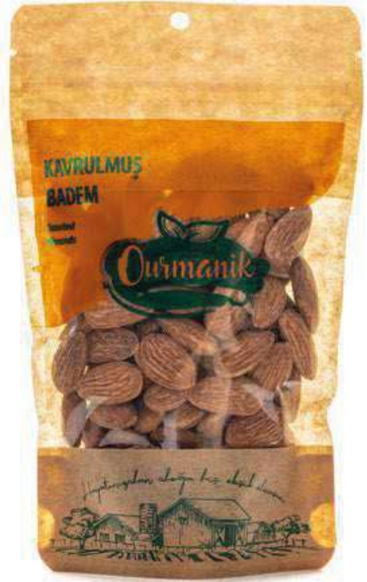
Kavrulmuş Badem Roasted Almonds