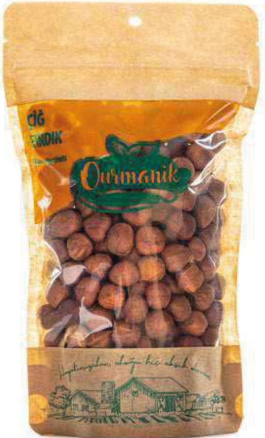
Çiğ Fındık Raw Hazelnuts