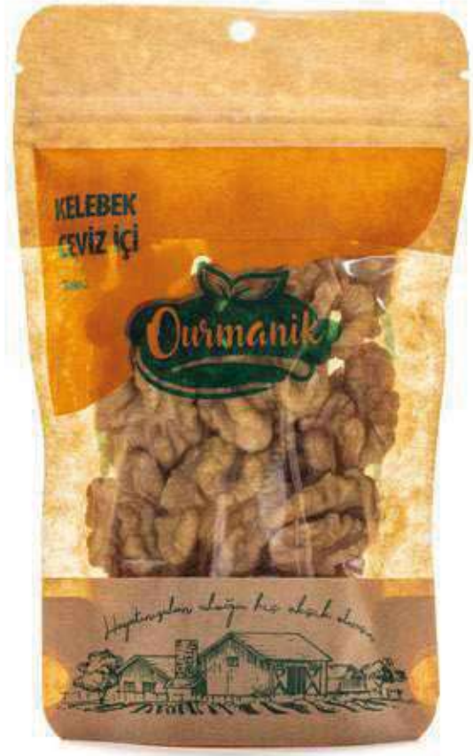
Kelebek Ceviz İçi Walnut