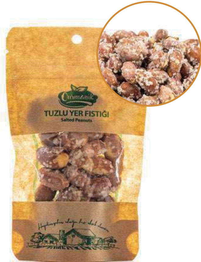
Tuzlu Yer Fıstığı Salted Peanuts