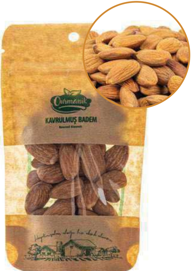
Kavrulmuş Badem Roasted Almonds