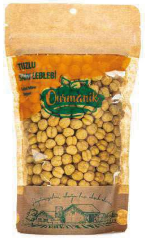
Tuzlu Sarı Leblebi Salted Yellow Chickpeas 180 GR