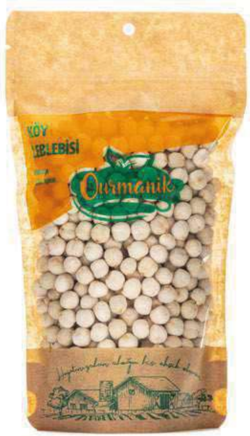
Köy Leblebisi Village Chickpeas 180 GR