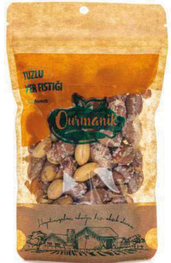
Tuzlu Yer Fıstıđı Salted Peanuts