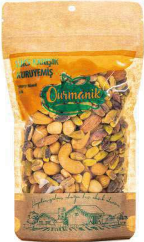
Lüks Karışık Kuruyemiş Luxury Mixed Nuts 180 GR