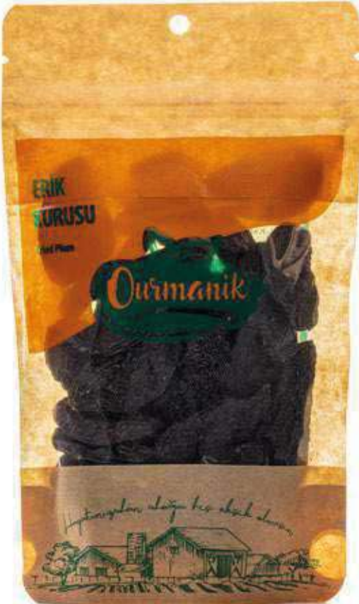
Erik Kuruşu Dried Plum