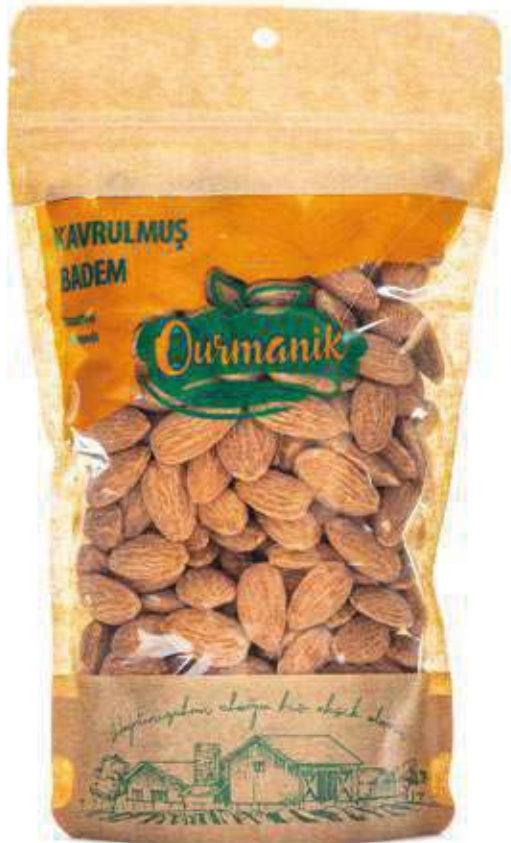
Kavrulmuş Badem Roasted Almonds