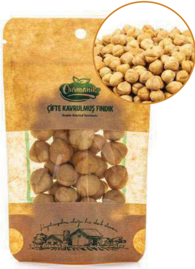
Çifte Kavrulmuş Fındık Double Roasted Hazelnuts