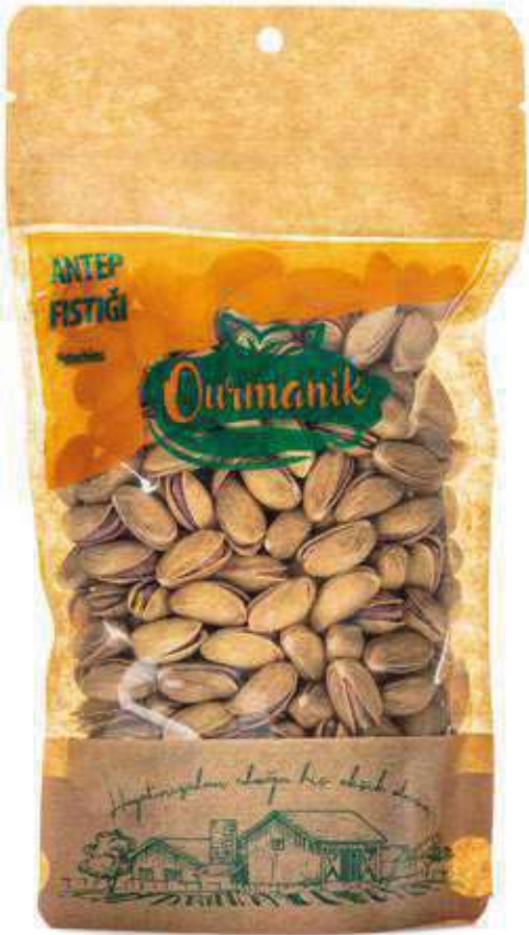
Antep Fıstığı Pistachios