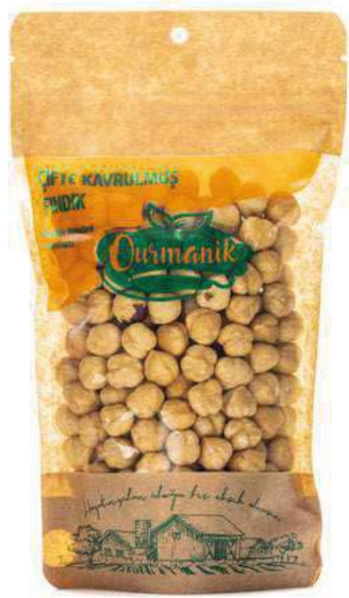
Çifte Karvulmuş Fındık Double Roasted Hazelnuts