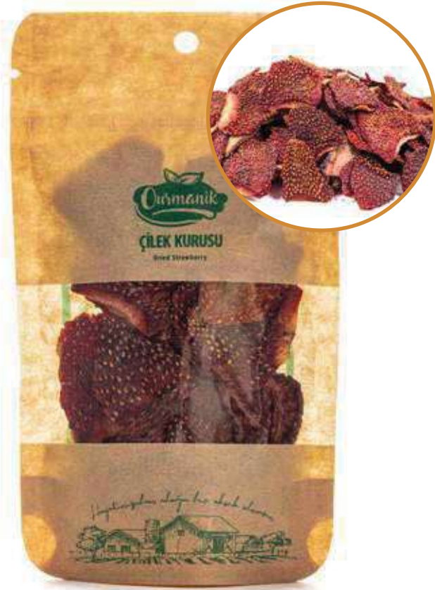
Çilek Kuru Dried Strawberry